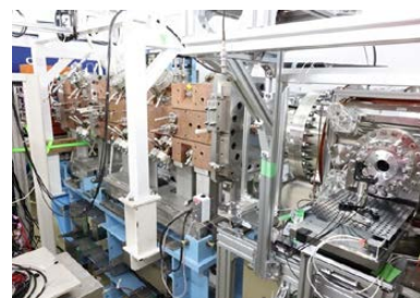
正ミュオン冷却・加速装置